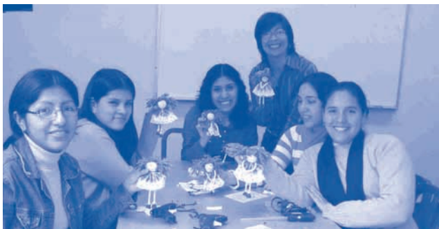
Alumnas de Surco confeccionaron muñecas de tela.

Como todos los meses, cada alumno puso su mejor esfuerzo y se lograron muy buenos resultados. ¡Felicitaciones a cada uno de ellos!