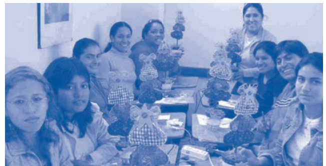
Las alumnas de San Miguel confeccionaron un arbolito navideño.